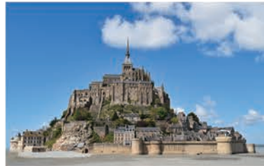
本家モン・サン・ミシェル

稜岳を下り、しろがね湿原にさしかかると、小さな岩峰があります。平坦な草原と岩峰の景色を、フランスの世界遺産でもある修道院になぞらえて、そのように呼ぶ人もいます。