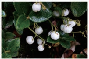
シラタマノキの実

山体崩壊によって出来た外輪山の稜線にあたるのが、このなだらかな天馬尾根。稜線上には雪田草原が広がり、高層湿原が見られます。