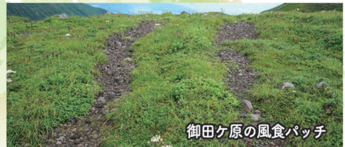
御田ヶ原の風食パッチ

高山植物がはいりこむことが可能になるのです。こうした裸地では植物の遷移が起りますので、段階的に多様な植物が入り込み、覚えきれないほどの花が鳥海山の夏を彩ることになります。