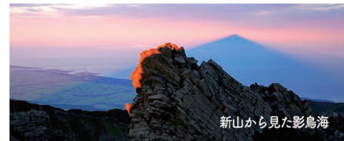
新山から見た影鳥海