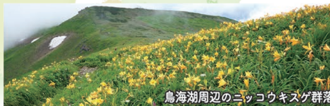
鳥海湖周辺のニッコウキスゲ群落