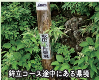
針立コース途中にある県境

現在秋田県 県境が不自然な形となったのは、江戸時代、矢島口の修験者と山形の蕨岡の修験者間による山頂争いを機に、 矢島藩と庄内藩の領土問題にまで発展しこれを重く見た奉行が、現地に赴き検地を行った結果定めたことによります。これが果たして公平なものだったのかは知る由もありませんが、かたや一万石にも満たない矢島藩と、14万石の大名である庄内藩の争いです。力の差が大き過ぎたのかもしれませんが。