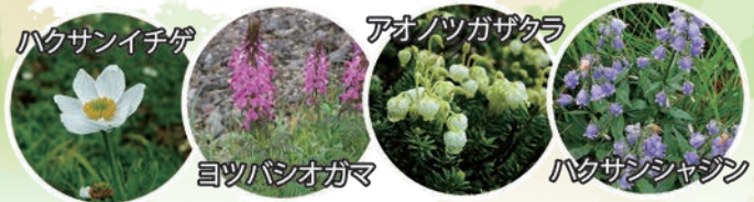
風食パッチに咲く花々

は、そんな強風によって植物が地表から剥ぎ取られてできたものです。一見無残な荒地にも見えますが、鳥海山の多彩な花の景色があるのには、こうした風食の存在が一役買っています。本来ならば、背の高い草原で覆われている地表に、風食パッチがあることでハクサンイチゲやチングルマなど