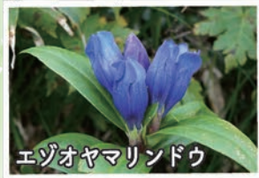
エゾオヤマリンドウ