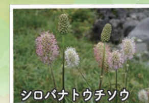
シロバナトウチソウ