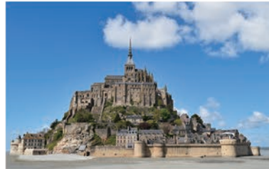
本家モン・サン・ミシェル

稜岳を下り、しろがね湿原にさしかかると、小さな岩峰があります。平坦な草原と岩峰の景色を、フランスの世界遺産でもある修道院になぞらえて、そのように呼ぶ人もいます。