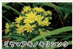
ミヤマアキノキリンソウ