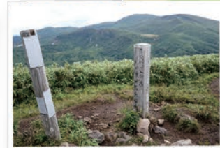
展望の良い株岳山頂